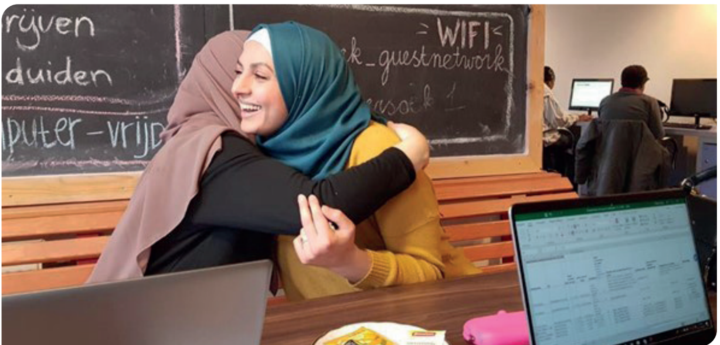
Het plan werd geboren een soort voedselbank op te richten maar dan voor computers.

En nu een aantal maanden verder, hoe verloopt de samenwerking? Goed! En waarom? Wij zijn beide organisaties met eenzelfde drive. Geen harde winst maar impact willen maken en creatief ondernemen, naar mogelijkheden kijken, niet naar beperkingen. De toekomst blijft spannend, we groeien hard en er is ontzettend veel vraag vanuit inwoners van Amsterdam naar een laptop maar daar kunnen we nu nog lang niet aan voldoen kwa begeleiding. Nieuwe partners zoeken die laptops aanleveren, afspraken met de gemeente, locaties uitbreiden voor begeleiding, kortom genoeg uitdagingen de komende tijd!