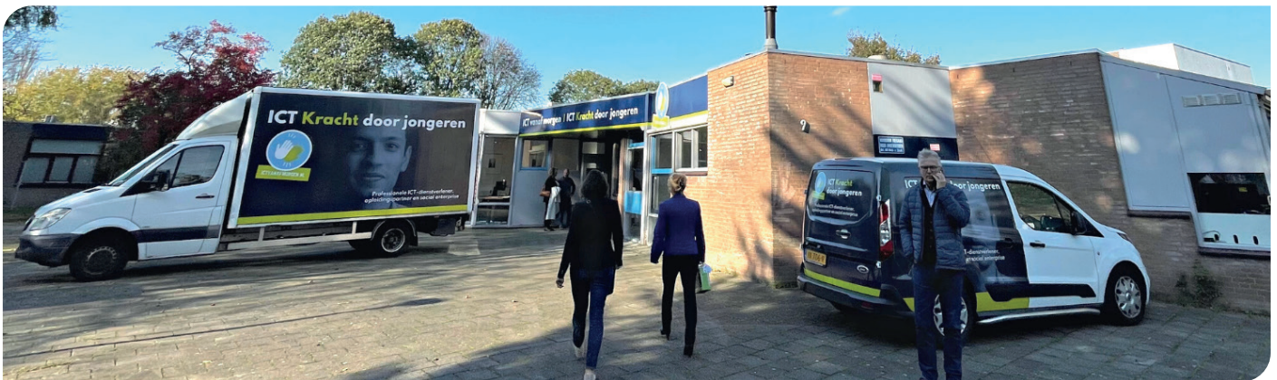
ICT vanaf Morgen Zaandam, regio Zaanstad-Waterland

Gemeente Amsterdam verstrekt laptops aan inwoners die het de middelen ontbreekt om een laptop aan te schaffen. De gemeente wil hierbij voorkomen dat deze doelgroep naast de nodige financiële zorgen ook nog digitaal wordt uitgesloten van de samenleving. Alleen een laptop verstrekken is om dit te bewerkstelligen niet voldoende want je moet ook wel weten wat je er allemaal mee kunt en hoe dan. Cybersoek verleent gratis ICT-cursussen en begeleiding aan Amsterdammers en neemt de distributie op zich. Hoe vervolgens de oprichting van de Cyberbank tot stand kwam leest u in in het interview dat wij met directeur Karien Sondervan mochten hebben