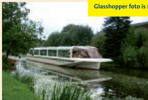
Glasshopper foto is slechte kwaliteit!!

Een vaartocht door de Graafstroom, waar u kunt genieten van de natuur en molens in de Alblasserwaard. Met een milieuvriendelijke rondvaartboot "de Glasshopper" krijgt u in 1,5 uur veel moois te zien. De kosten zijn €12,50 p.p. Aan boord zijn consumpties voor eigen rekening. U kunt zich inschrijven t/m 3 september bij een medewerker van team welzijn. Consumptie voor eigen rekening en de taxi kosten worden gelijk verdeeld.